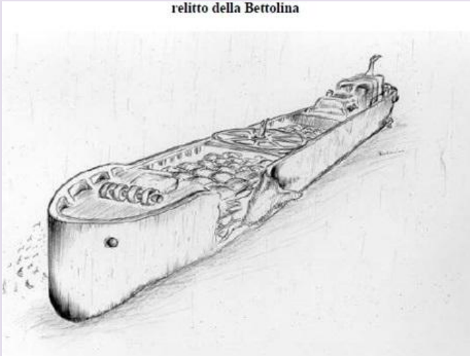
relitto della Bettolina