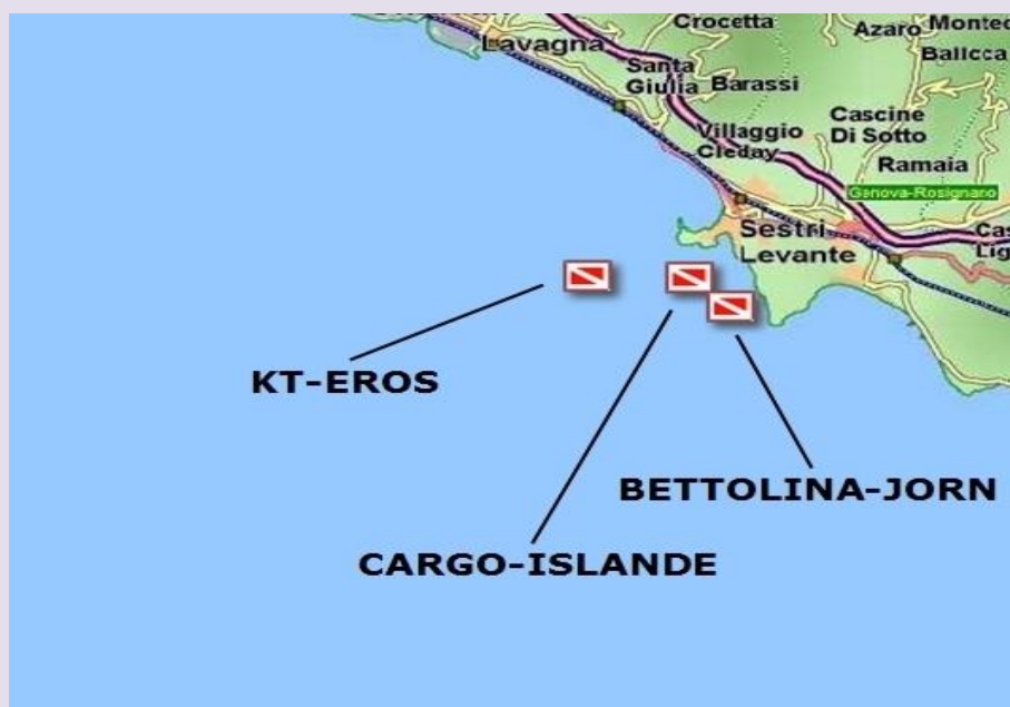
relitto del Cargo Armato